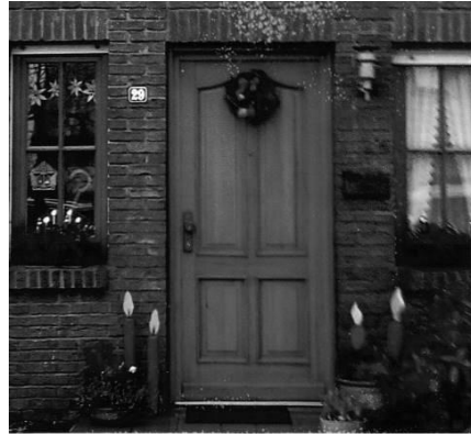
Eine Adventstür in Leist 1

An den Abenden des vergangenen Advents trafen wir uns vielerorts in der Kirchengemeinde, um wieder miteinander zu singen und zu erzählen, um Vortragenden zuzuhören und liebevoll Darge-reichtes gemeinsam zu genie-ßen. Rückblickend sei daran erinnert, dass unsere Gastgeber vor Öffnung eines Fensters häufig umfangreiche Vorberei-tungen getroffen haben, um uns eine frohe halbe Stunde zu bereiten. Allen Beteiligten, die für diese großartige Vielfalt lebendiger adventlicher Ge-meinschaft gesorgt haben, sind wir sehr dankbar.